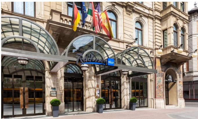
Közgyűlés /2. oldal