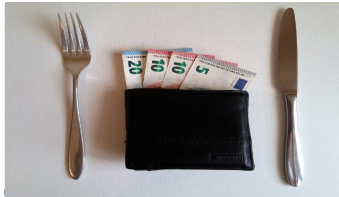
Német reakciók /7. oldal