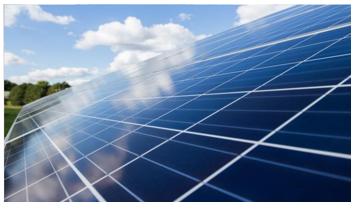
Zöld reptér /5. oldal