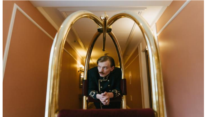
Mindent az új munkaerőért /5. oldal