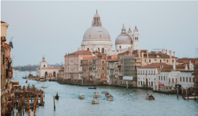
Megváltozott szokások? /3. oldal