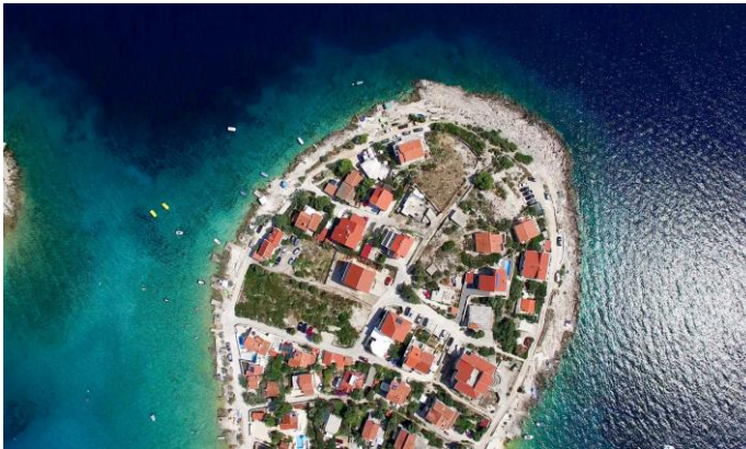
Horvát példa /6. oldal