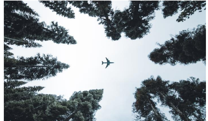
A versenyképességnek annyi? /8. oldal