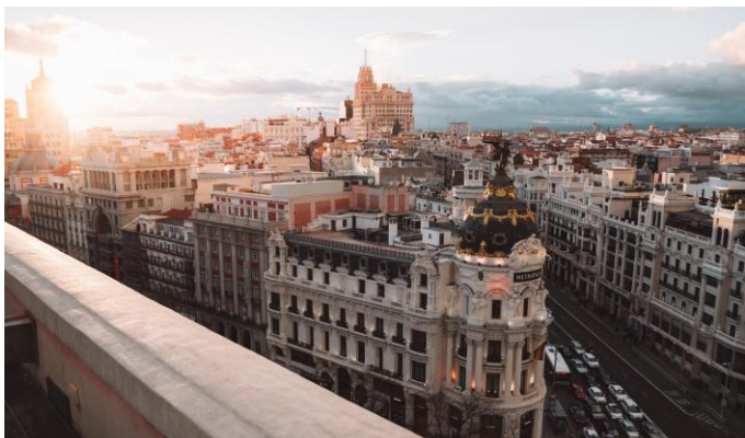
Spanyol elrugaskodás /3. oldal