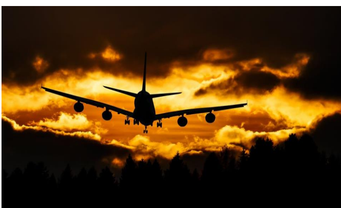
SAF helyzet /8. oldal