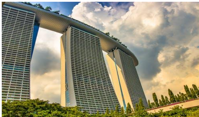
A Marina Bay megújul /4. oldal