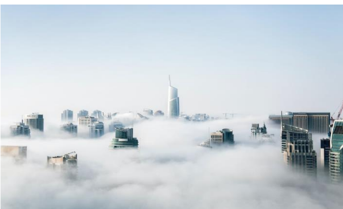
2022: újabb kihívásokkal teli év /7. oldal